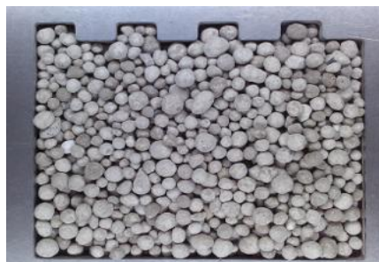
Calciprill S 14 (83018457)